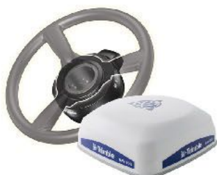
Autopilot Motor Drive para GFX-750