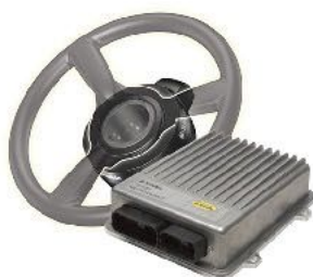
Autopilot Motor Drive para resto pantallas

Máxima precisión, facil instalación y motor eléctrico.