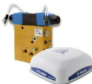
Autopilot Hidráulico para GFX-750