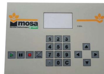
T055.S Micro-Computer Step01 Versione 220 Volts Monofase

Micro-computer system Step01 220 Volts 1Ph version