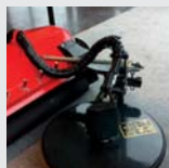
Disco lateral de deslocamento hidráulico.