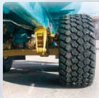
Pneumatici a larga sezione e bassa pressione di gonfiaggio. Large-section, low inflation tyres.