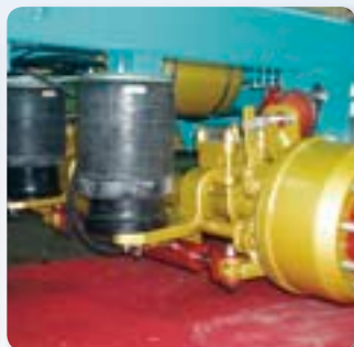
Sospensione pneumatica industriale con valvola livellatrice e molla a ginocchio. Industrial-type pneumatic suspension with grading valve and knee spring.