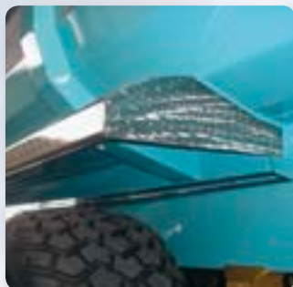
Parafanghi inox o ferro. Stainless steel or iron wings.