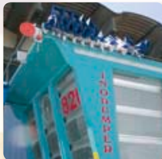
Copertura del cassone del tipo Copri-Scopri, con motorizzazione elettrica od idraulica, per il contenimento dei prodotti polverosi. The dump body is equipped with an electrically- or hydraulically-operated pull on/pull off covering, for covering dusty products.