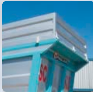
Sovrasponde smontabili - Sponda anteriore idraulica. Removable top edge - Hydraulic front side panel.