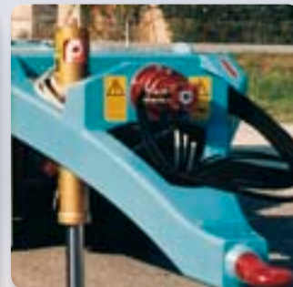
Pompa di ribaltamento tramite motore idraulico, con eliminazione della trasmissione cardanica. The dumping pump is operated by a hydraulic motor, with no need for a cardan drive.