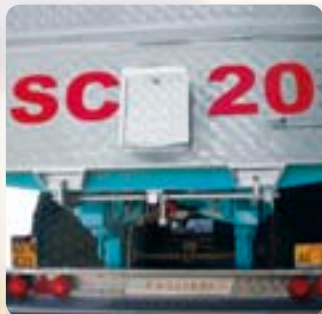
Bocchetta di scarico posteriore per la granella. Back opening for the unloading of grains.