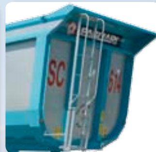
Scaletta di ispezione anteriore o posteriore. Ramp inspection.