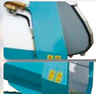
Portellone a chiusura idraulica e perfetta tenuta stagna. Perfectly-waterlight, hydraulically-locked door.