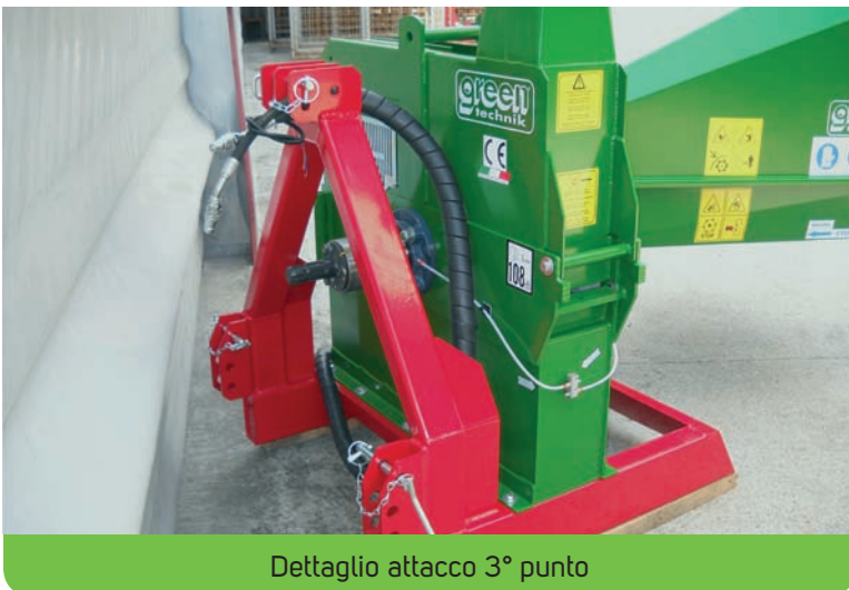
Dettaglio attacco 3° punto