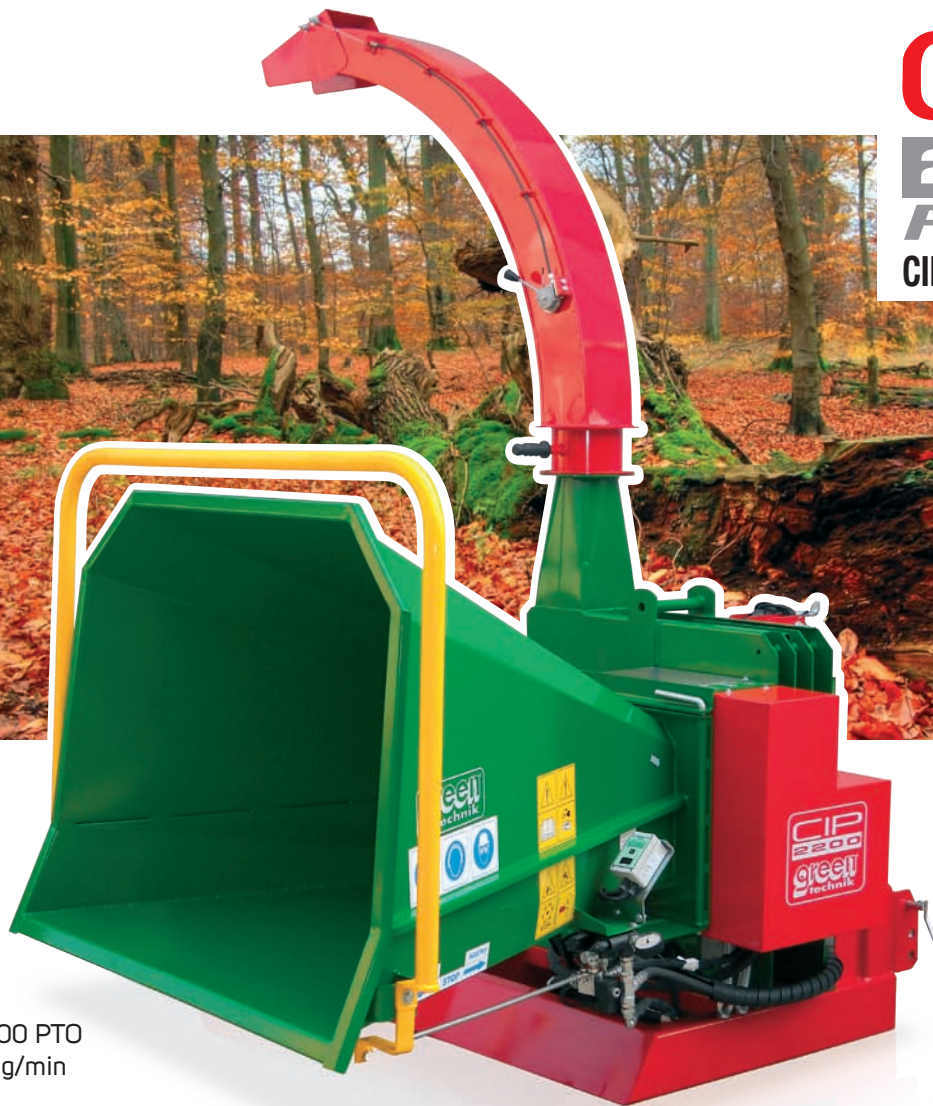
CIP 2200 PTO 1000 g/min