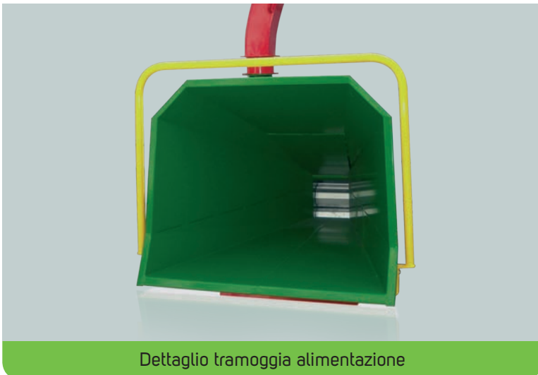
Dettaglio tramoggia alimentazione

E Astilladora profesional capaz de trabajar ramas con un diámetro máximo de 220 mm. Es la máquina ideal para quien tiene que eliminar grandes volúmenes y que, al mismo tiempo, desea también trabajar diámetros importantes. La alimentación hidráulica de los dos rodillos es independiente y es accionada con la instalación del tractor. El accionamiento del rotor con rotación 1.000 rev./m' sobre la toma de fuerza del tractor, reduce la absorción de potencia, aumentando las prestaciones. El sistema especial de corte en el nuevo rotor de disco doble, con sistema de refinación, permite obtener un chip muy uniforme, apto para la alimentación de calderas de chipeado.