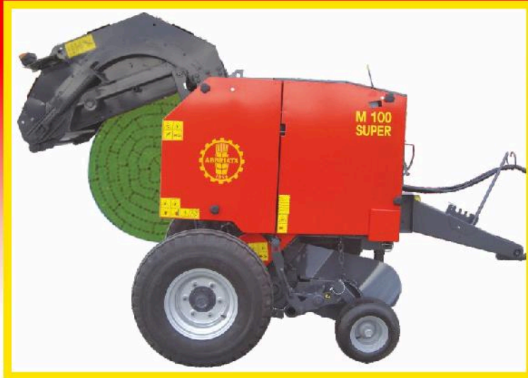
Vista laterale macchina ballone a centro morbido formato in camera fissa a catena e traversine. Lateral view with a sketch of soft center round bale made by fixed chamber with chain and bars.