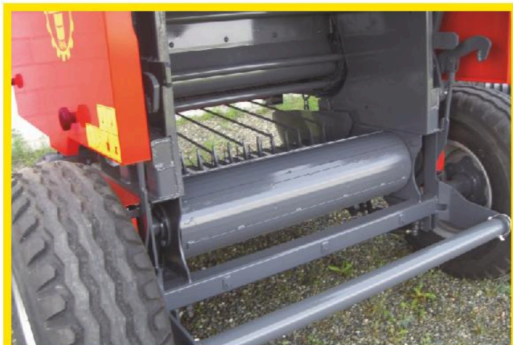
Vista posteriore con allontanatore, rullo, denti infaldatore e catenaria con traversine. Rear view with bale chute, roll, packer device teeth and chain & bars.